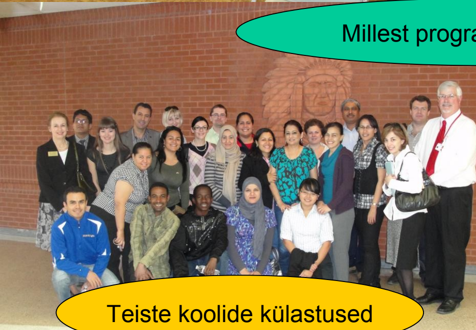
Teiste koolide külastused