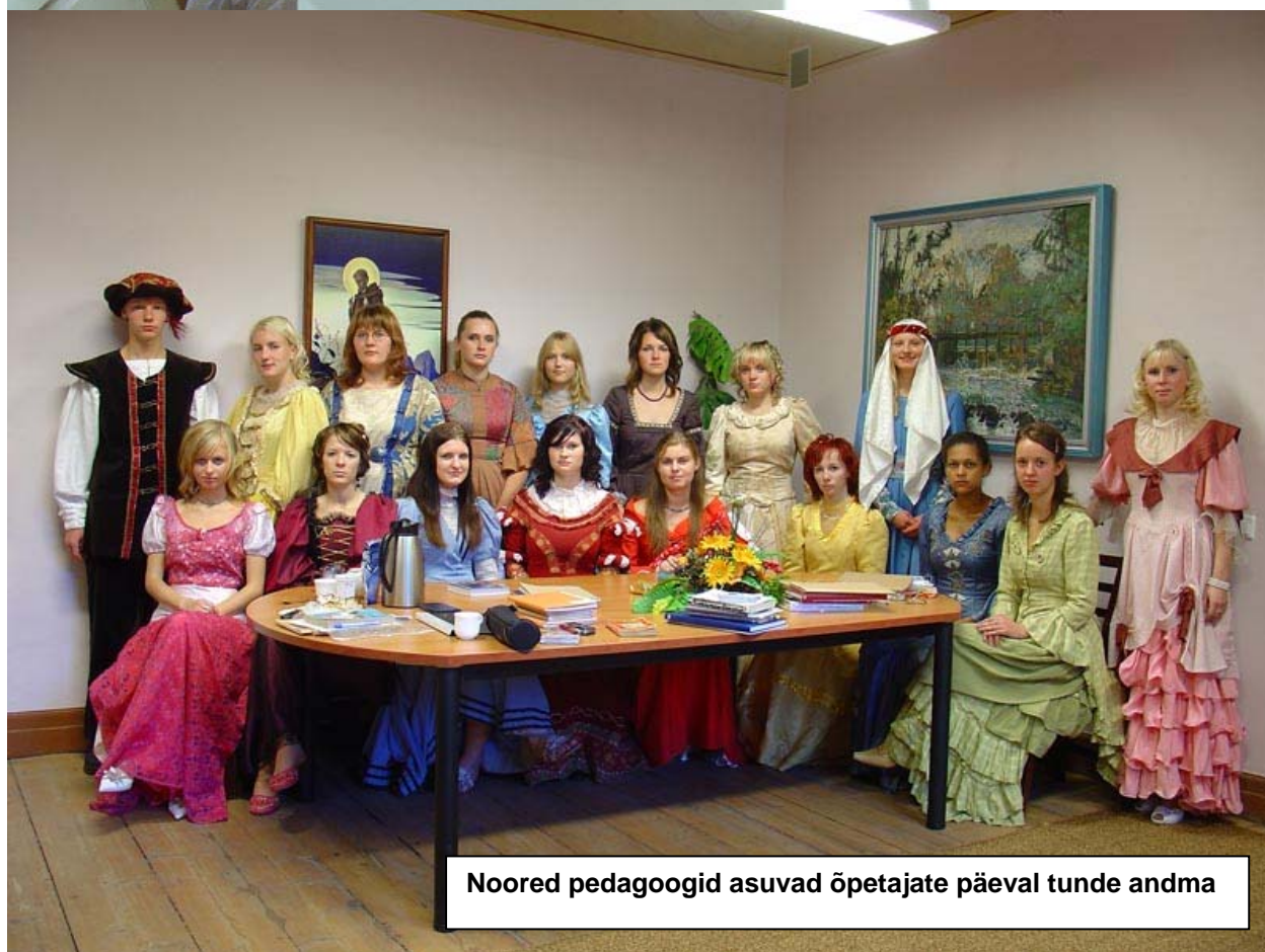
Noored pedagoogid asuvad õpetajate päeval tunde andma