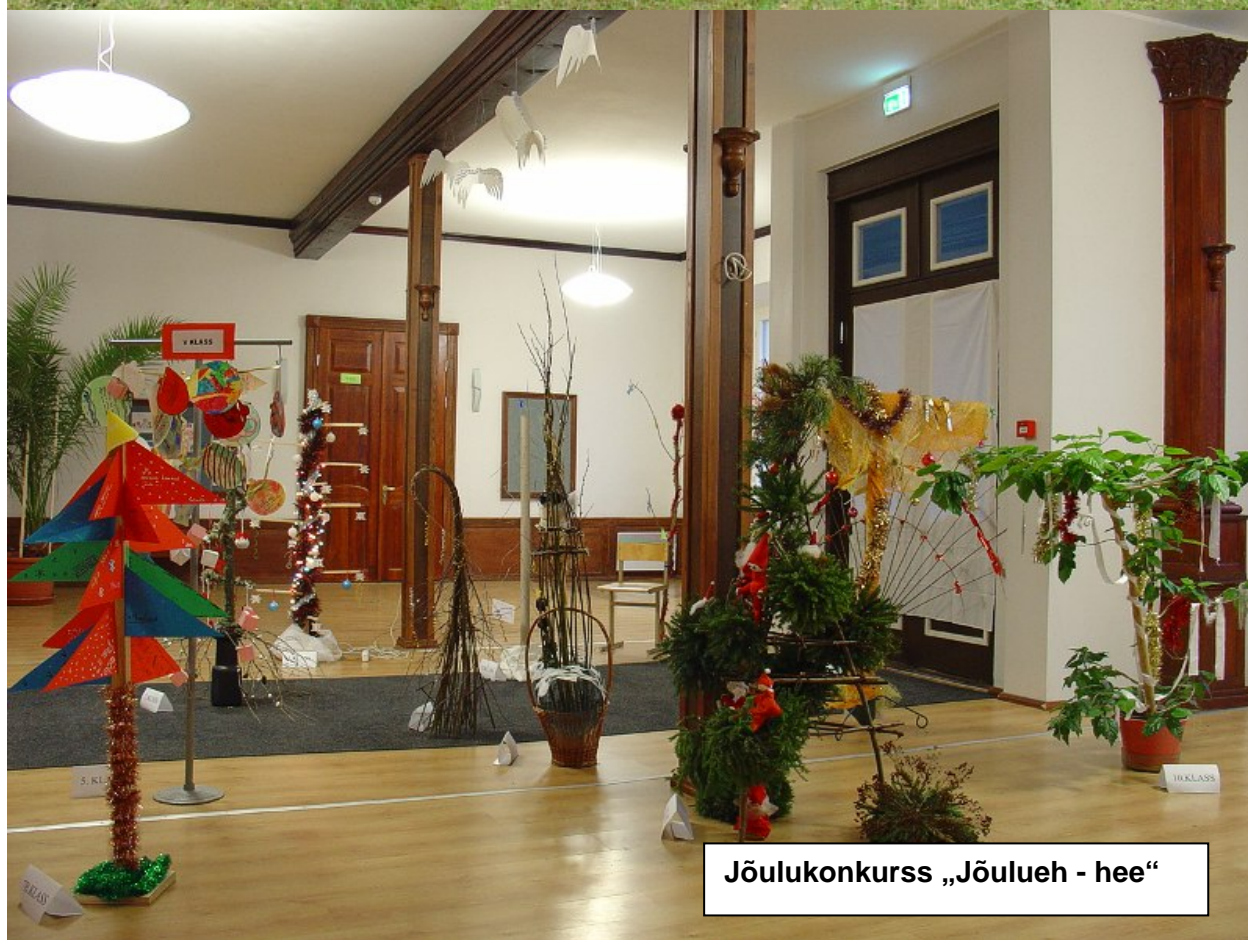
Jõulukonkurss „Jõulueh - hee“