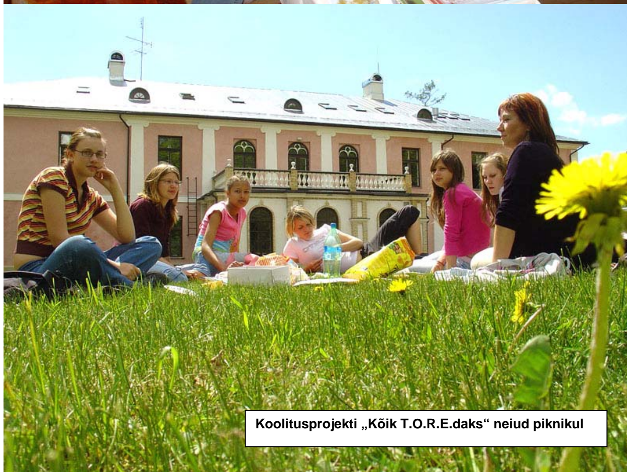
Koolitusprojekti „Kõik T.O.R.E.daks“ neiud piknikul