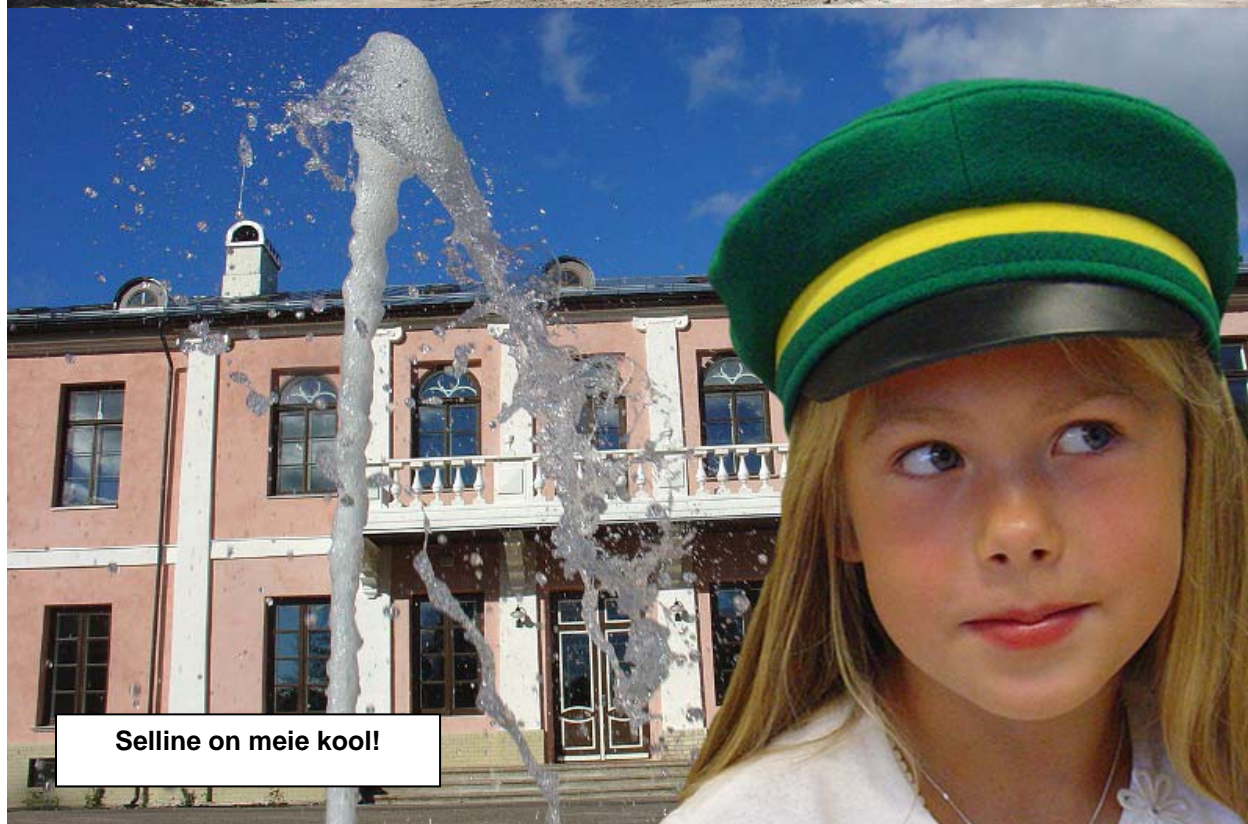
Selline on meie kool!