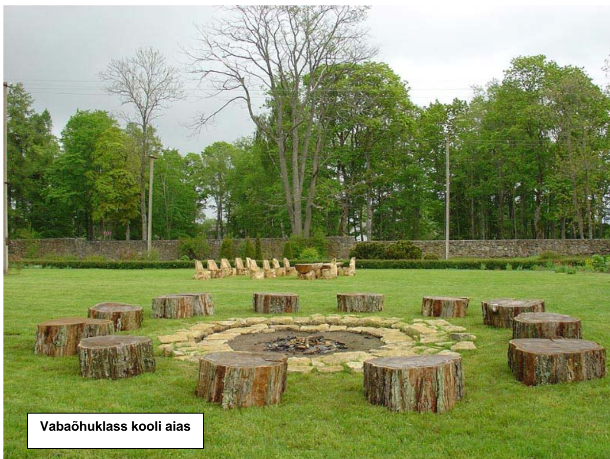
Vabaõhuklass kooli aias