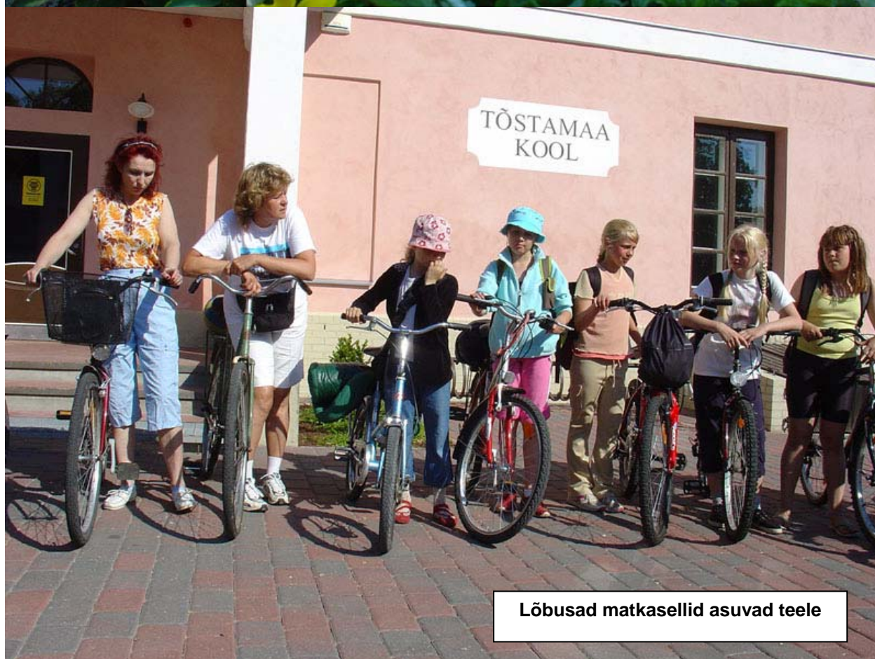
Lõbusad matkasellid asuvad teele