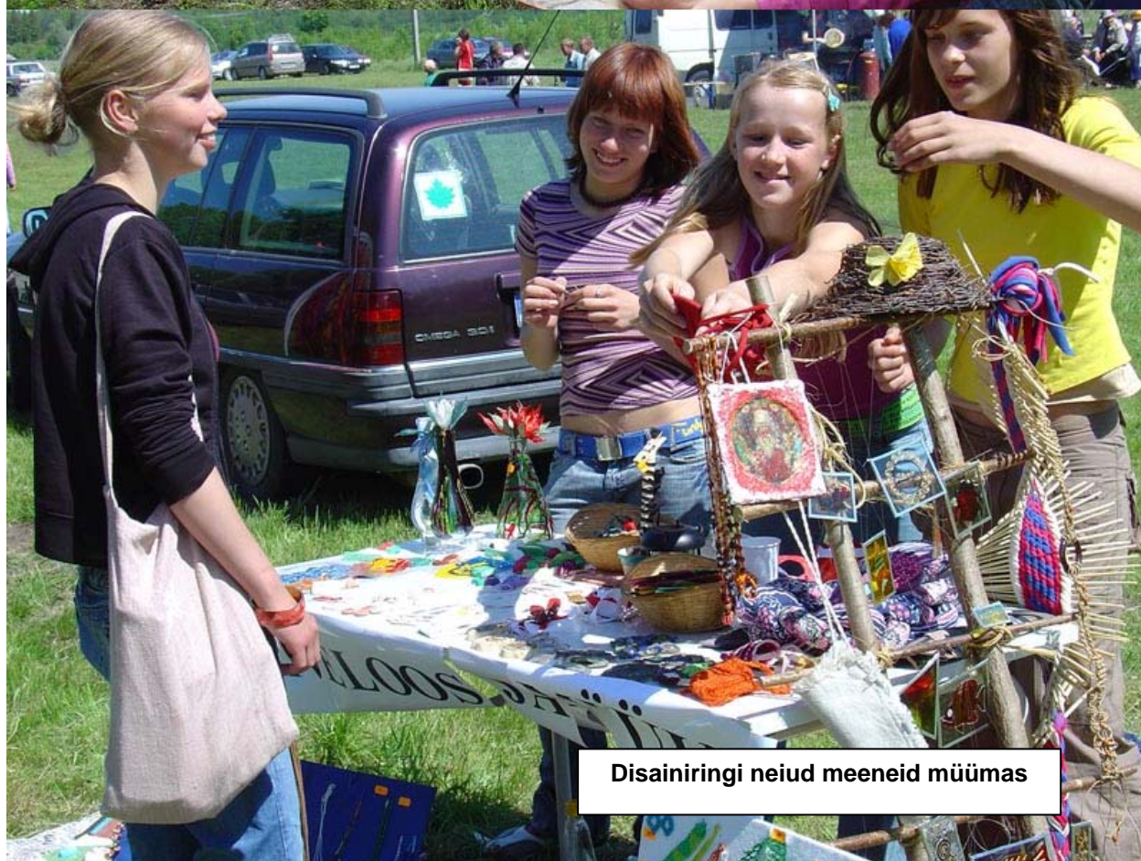
Disainiringi neid meeneid müümas