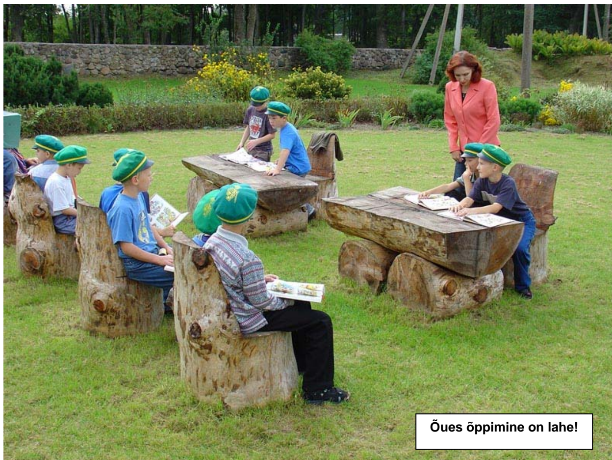
Õues õppimine on lahe!