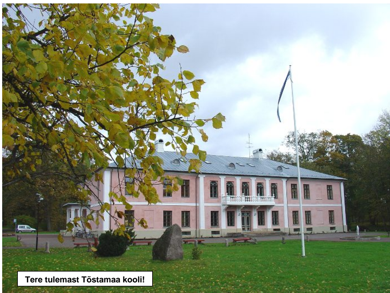
Tere tulemast Tõstamaa kooli!