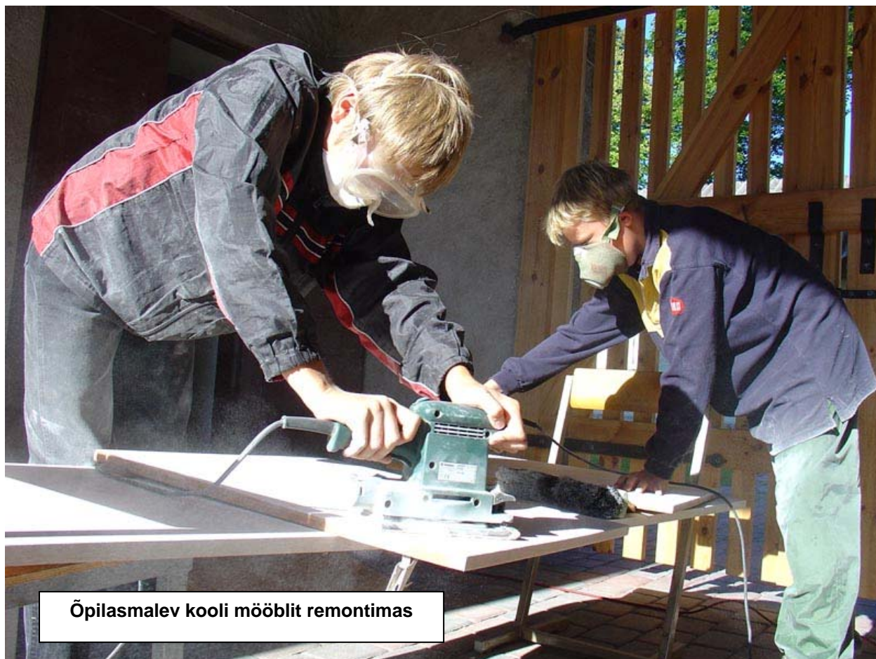
Õpilasmalev kooli mööblit remontimas