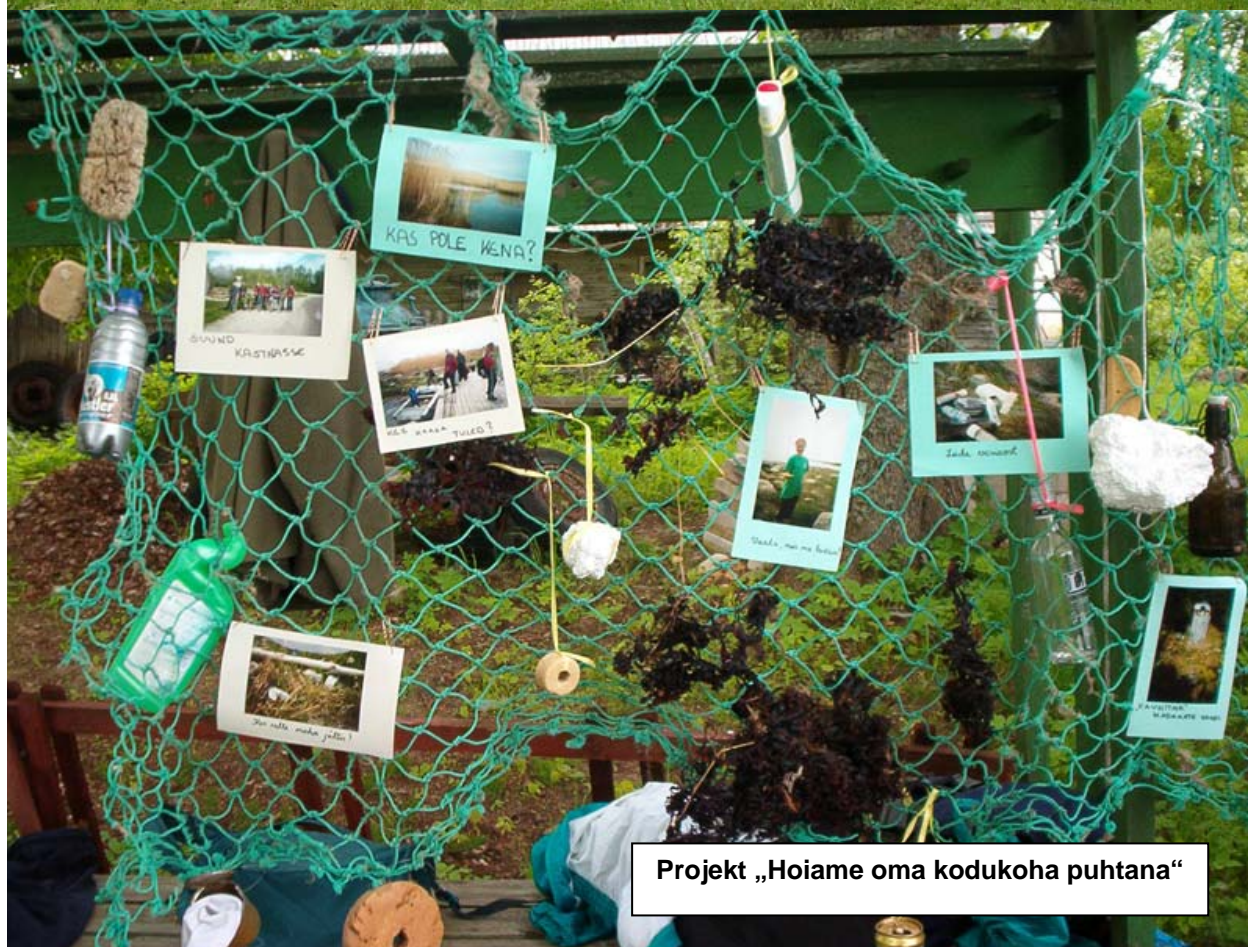
Projekt „Hoiame oma kodukohta puhtana“