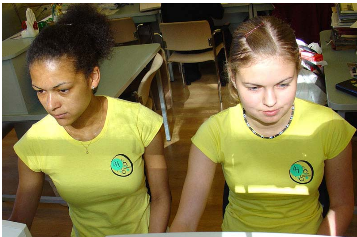
4H klubi Positiivne