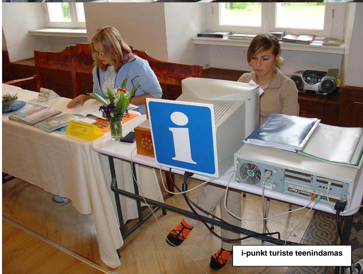
i-punkt turiste teenindamas