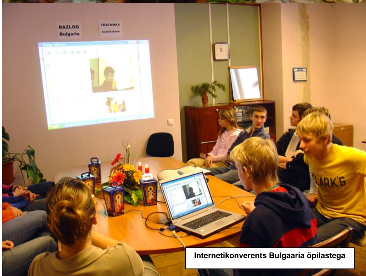
Internetikonverents Bulgaaria õpilastega