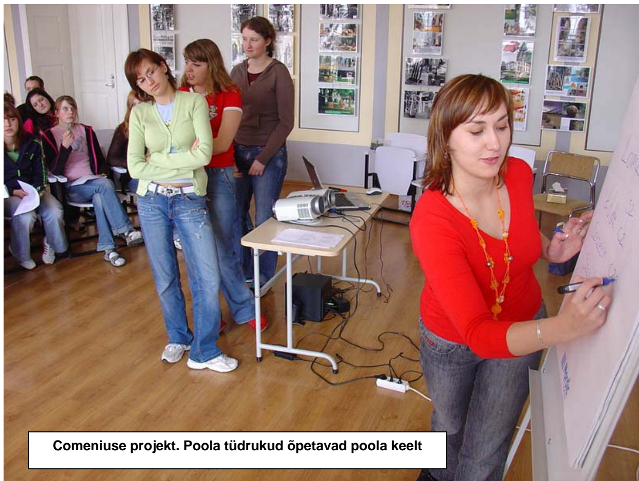
Comeniuse projekt. Poola tüdrukud õpetavad poola keelt